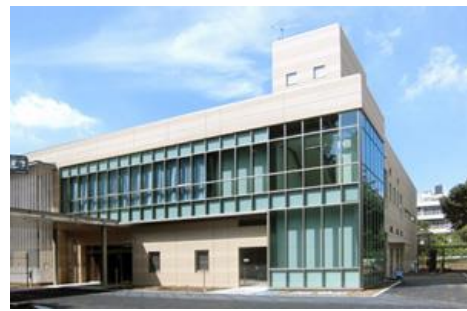
神奈川県立医療センター医療観察法病棟