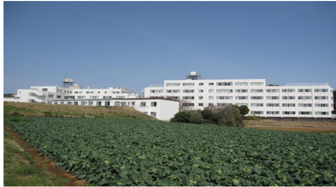
基幹施設の医療法人財団青山会福井記念病院