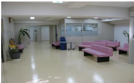
青山会関内クリニック待合室