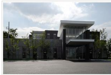
横浜カメラアホスピタル