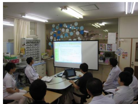
病棟カンファレンス