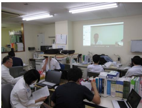
Skypeによる合同抄読会

専攻医としての研修期間は3年間ですが、4年目に専門医試験のためのレポート提出（4月末）、指定医レポート提出（6月末）、専門医試験（8月）などがあり、研修した病院にその期間も在籍していた方が良いということがあります。そのことを考慮し、1年間の延長を勧めています。