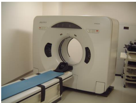
全身（頭部）CT撮影装置

外来診療・精神科デイケアを行うとともにうつ病を対象とした復職支援プログラムも取り入れています。うつ病、不眠症など軽症の疾患に対する精神科的治療を体験できます。