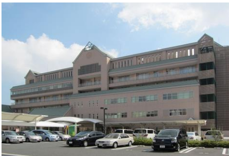
神奈川県立こども医療センター