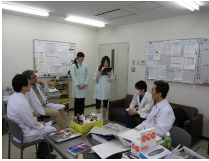
毎朝ソーシャルワーカーと情報交換