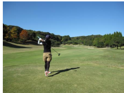
ゴルフコンペなどでスタッフと交流