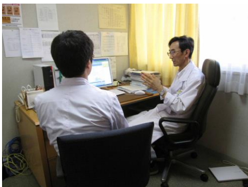
指導医によるスーパービジョン