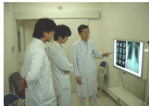
レントゲン・CTの読影