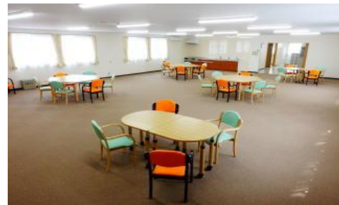
青山会津久井浜クリニックデイケア