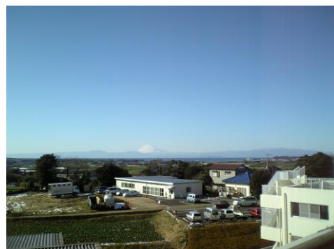
福井記念病院より富士山を望む